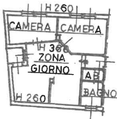
PIANTA PIANO TERZO SOTTOTETTO H 310